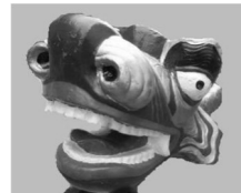
KGN - Drachenbootsport