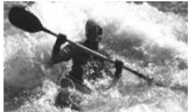
KGN - Wildwassersport