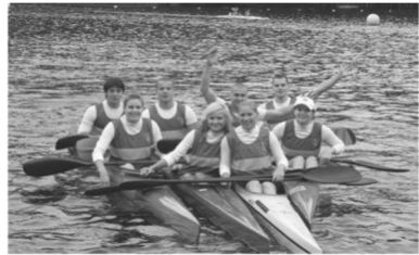
KGN - Rennsport