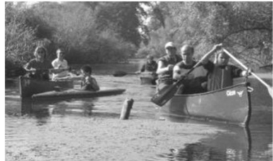
KGN - Wandersport